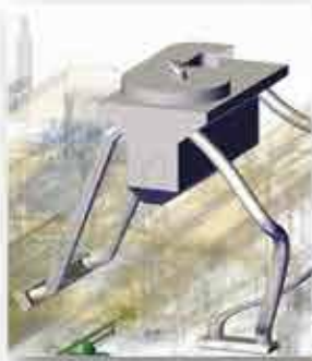
Toz Emme Sistemi