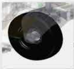
İlave Ön Teker